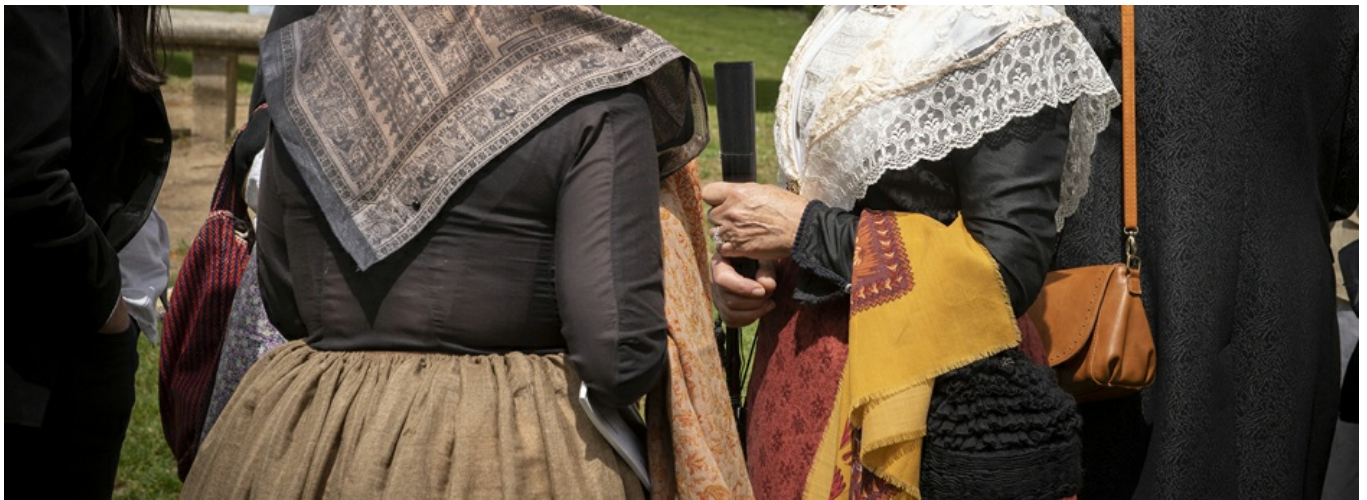
Sceaux à l'heure du Midi

Originaire du Languedoc, Florian avait situé l'action de son roman pastoral Estelle sur les bords du Gardon et il avait enrichi cet ouvrage en français d'une chanson en « languedocien ». Au 19 e siècle, cela lui valut d'être considéré comme précurseur de la tradition par les tenants de la renaissance de la langue d'oc, aux premiers rangs desquels figuraient les membres du Félibrige, mouvement littéraire de défense et de promotion de la « langue du Sud », fondé en 1854 par Frédéric Mistral et quelques amis.