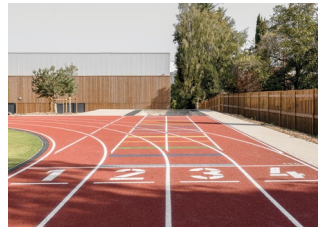
26 bis avenue Jean-Jaurès