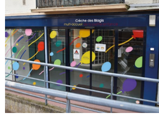
10-12 rue du Docteur-Roux