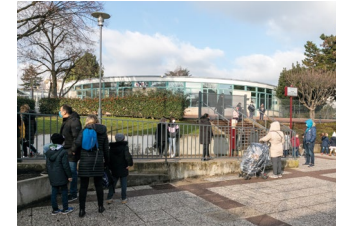
2 place des Ailantes