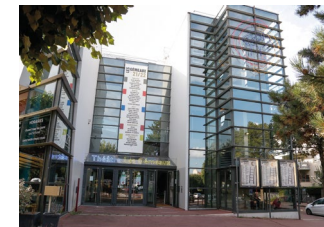
49 avenue Georges-Clemenceau