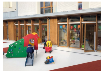
2 rue Albert 1 er