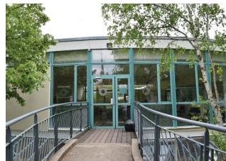
48 bis rue de Bagneux