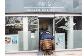
10 rue du Docteur-Roux