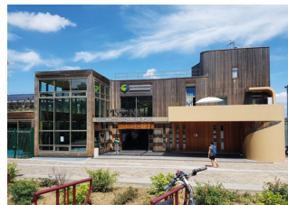
5 Rue de l'Yser