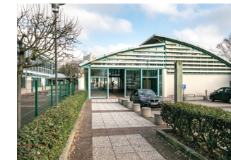
6 place des Ailantes